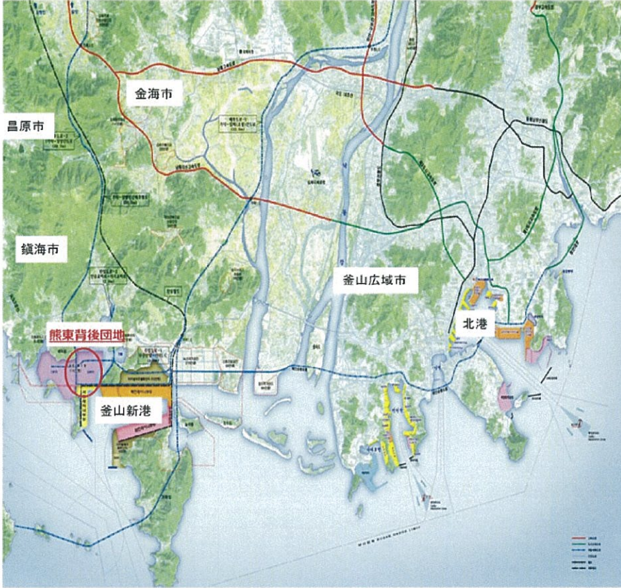
▼ 事業所 位置図